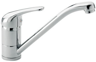
Monomando S1000 - RO 8443 002